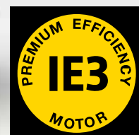
Rys.: SXC 8